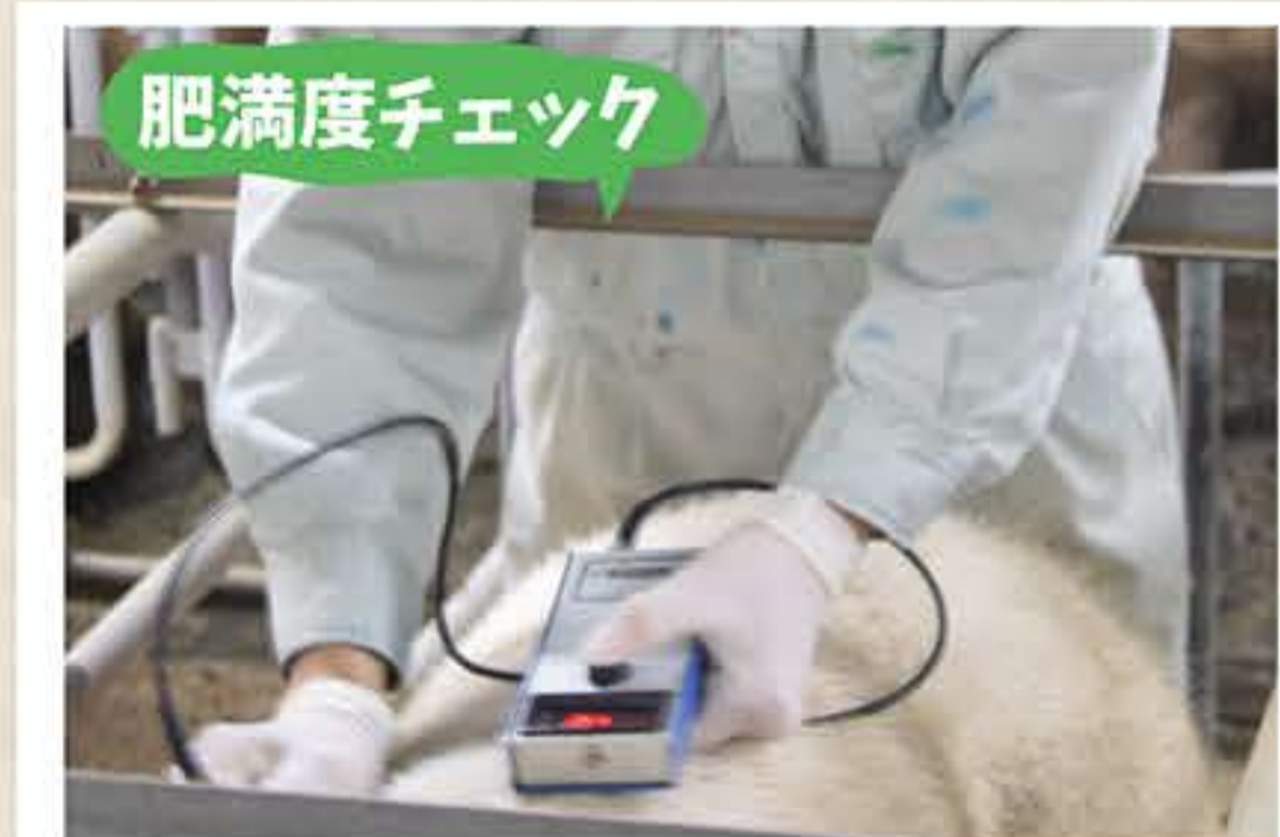
背脂肪の厚さを計測しています。

安全・安心・おいしいがモットーの『元気豚』。でも『元気豚』ってどうやって育てられているの？ 今回はその疑問にお答えするために、農場の裏側を潜入調査してきました！ 調査結果⇒農場は、母豚1頭ずつ、体調や体形に合わせて細かく管理されているところでした！