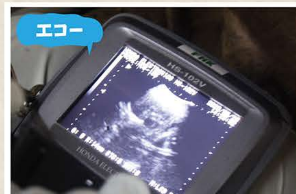
中心から下あたりの黒い影が赤ちゃんです！