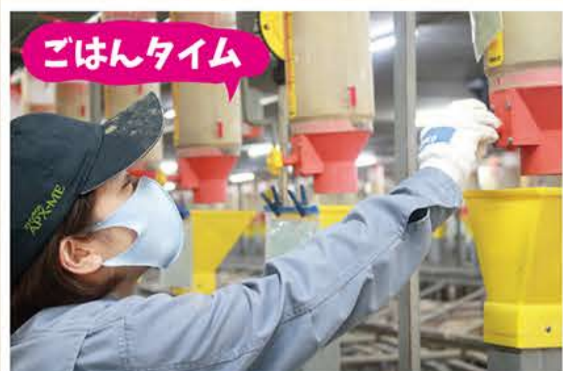
1頭ずつ、体調に合わせて餌の量を変えています。