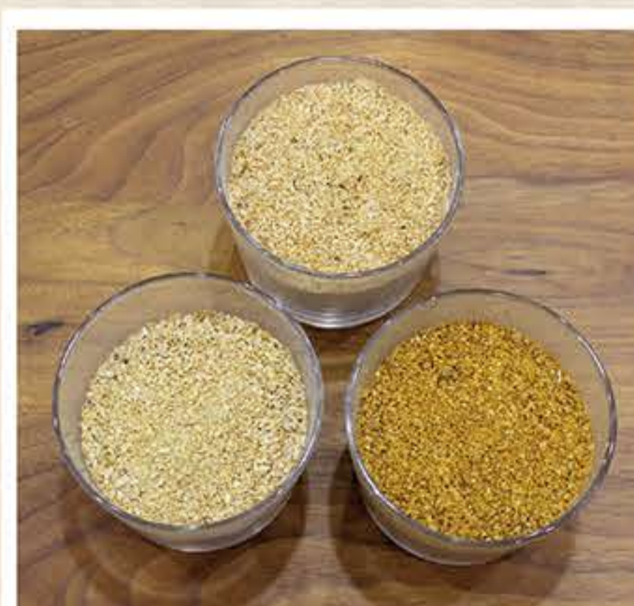
適した餌を適量食べて、元気にスクスク育ちます。