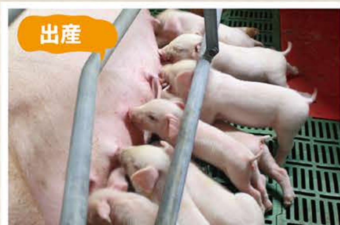
1度のお産で約13頭の子豚が産まれます。

母豚1頭ずつの体調管理を徹底しているからこそ、『元気豚』は健康で元気に育つことができますね。