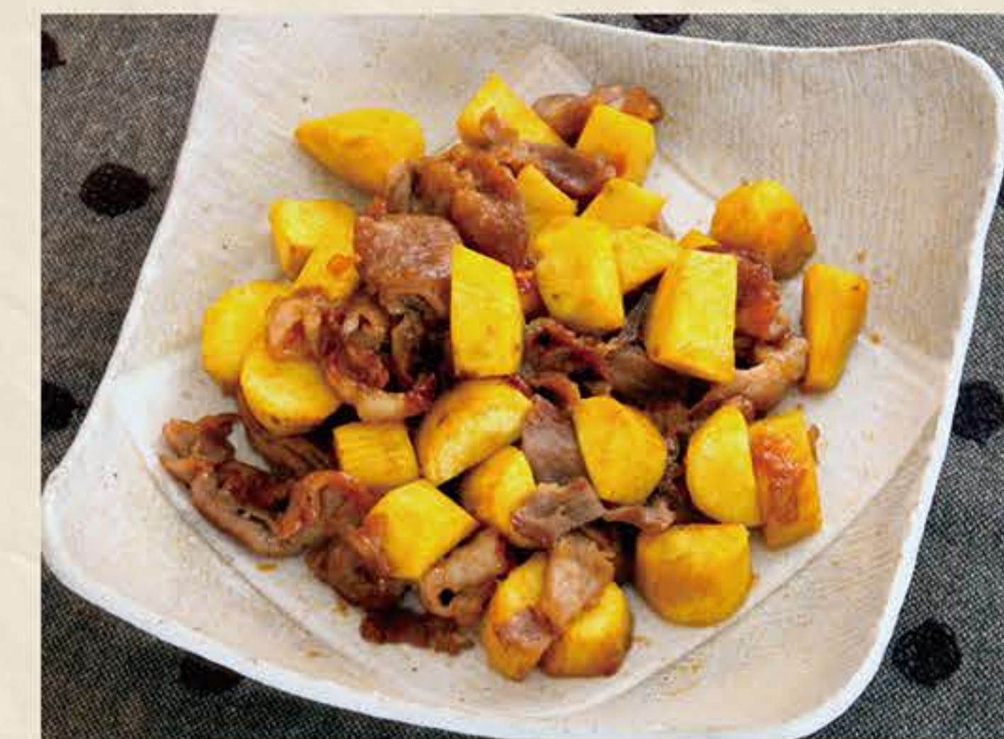
甘いさつまいもと肉の相性が抜群です！